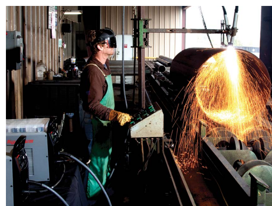
Резка труб и косые срезы