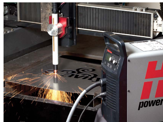
Резка на координатном столе