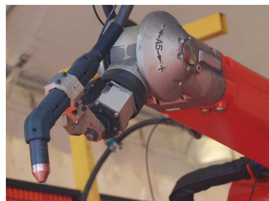
Роботизированная резка в трехмерном пространстве

*Коэффициенты: 20:1, 21.1:1, 30:1, 40:1 и 50:1